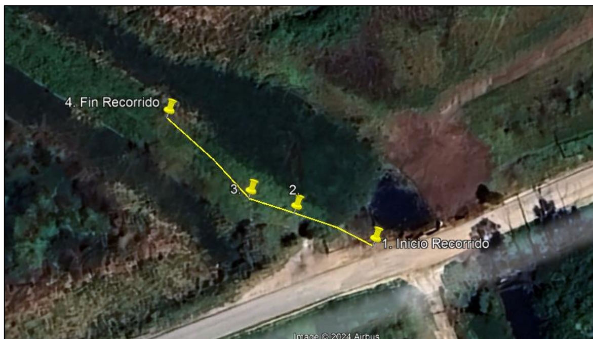
Ilustración 1. Recorrido verificación ambiental – Casco Urbano - La Ramada.

El día 02 de agosto de 2024, se realizó recorrido de control y vigilancia en la ronda del Humedal Gualí desde las coordenadas 4°42'21.678"N - 74°10'45.084" W hasta las coordenadas 4°42'21.72"N - 74°10'47.004" W (ver ilustración 1. Ruta amarilla) ecosistema que fue declarado por la Corporación Autónoma Regional de Cundinamarca - CAR como Distrito Regional de Manejo Integrado a través del acuerdo 001 de 2014 "Por medio del cual se declaran como Distrito Regional de Manejo Integrado (DMI), los terrenos comprendidos por los humedales de Gualí, Tres Esquinas y Lagunas de Funzhé, y su área de influencia directa ubicada en los municipios de Funza, Mosquera y Tenjo, Cundinamarca", y estableció tres zonas: 1. Preservación (espejo de agua), 2. Recuperación (50 metros) y 3. Uso sostenible (100 metros), con el fin de verificar las condiciones ambientales, identificar posibles afectaciones a los recursos naturales y realizar las acciones de prevención correspondientes.